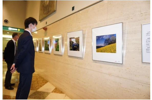
以前に開催したときの様子

が主催するやすらぎ事業として開催いたします。期間中当院にお立ち寄りの際はぜひご鑑賞ください。